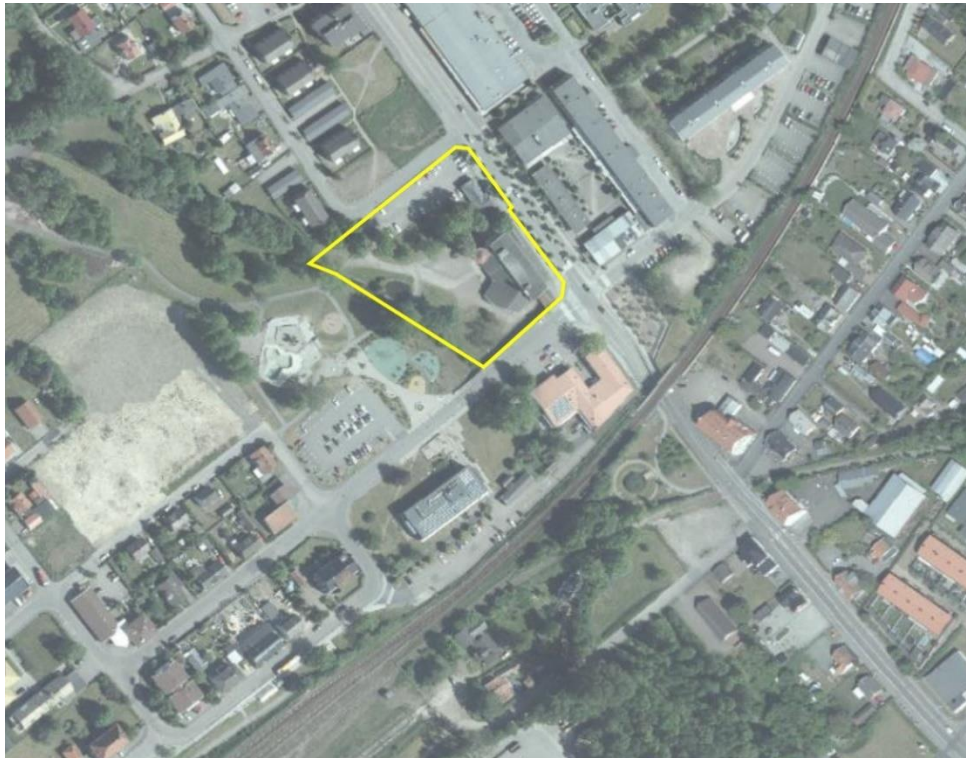
Området som omfattas av förslag till ny detaljplan