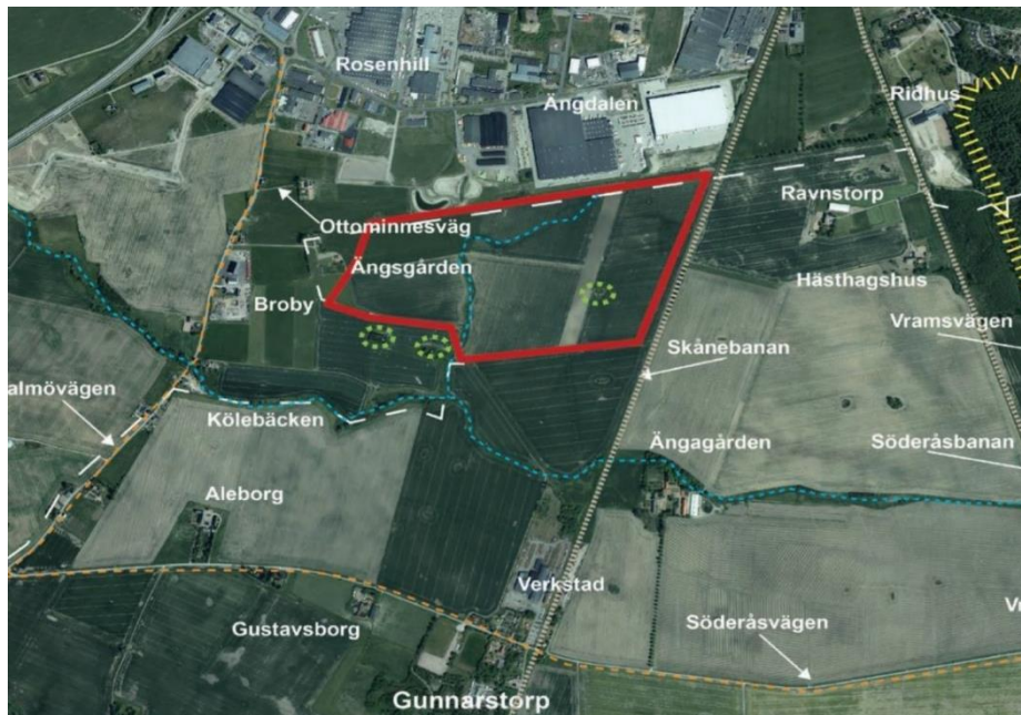
Området som omfattas av förslag till ny detaljplan

Detaljplanen handläggs med utökat förfarande, då detaljplanen kan antas medföra en betydande miljöpåverkan, enligt plan- och bygglagen SFS 2010:900.