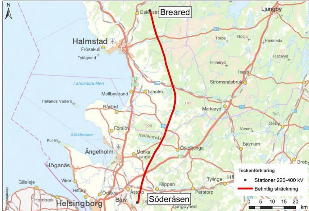
Figur 1 ovan, ett skärmutklipp från bilaga (MKB) i remitterat material, visar nätkoncession för linje mellan Breared och Söderåsen.