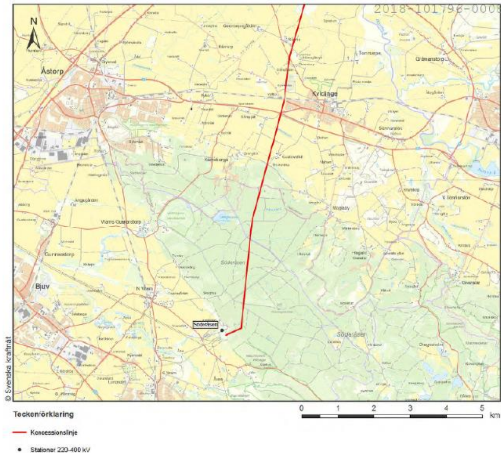
Figur 2 ovan, ett skärmutklipp från bilaga 5 i remitterat material, visar nätkoncession för linje mellan Söderåsen i Bjuvs kommun och Breared i Halmstad kommun.